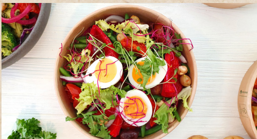
Dagens bowl med grønt, protein, mejeri