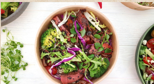
Lynstegt oksekød og nudler

- en fleksibel, individuel og inspirerende frokostoplevelse hver dag