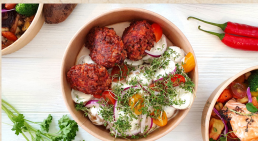
Rødbedefrikadeller og kartoffelsalat